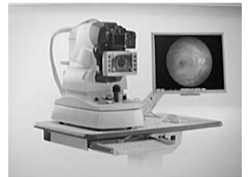
無散瞳眼底カメラ

人間の身体の中で、唯一生きた血管の状態を観察できるのが眼底検査です。眼底検査によって緑内障や網膜の病気等、目の病気だけでなく、高血圧、動脈硬化、糖尿病等の病気の進行状態も知ることができます。