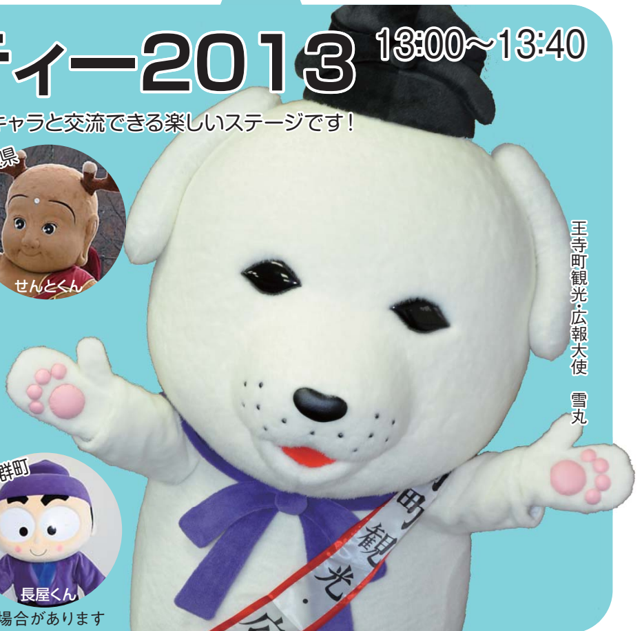
王寺町観光・広報大使 雪丸