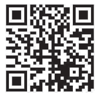
マイタイムライン