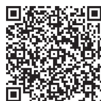
コンビニ等 の証明書発行