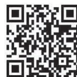
地方税お支払サイト

※住所を変更した人や県外ナンバーの自動車を持っている人は、運輸支局ですみやかに変更登録の手続をしてください。