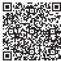
戸籍証明書等 の取得