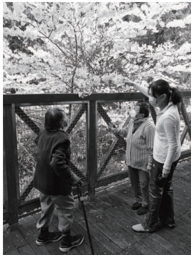
デイサービスで満開の桜を楽しみました

今後とも、大塔ライフハウスの活動について、ご支援・ご協力をよろしくお願い申し上げます。