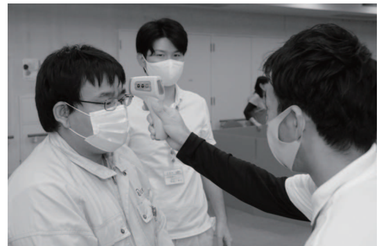
避難所従事職員の訓練の様子

※①や②に該当する人は、専用避難所に直接避難するのではなく、 まず危機管理課に連絡 してください。