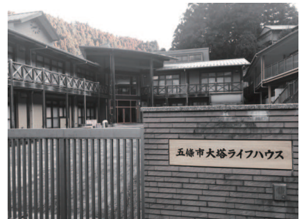
大塔ライフハウスとして生まれ変わった旧大塔小中学校の校舎