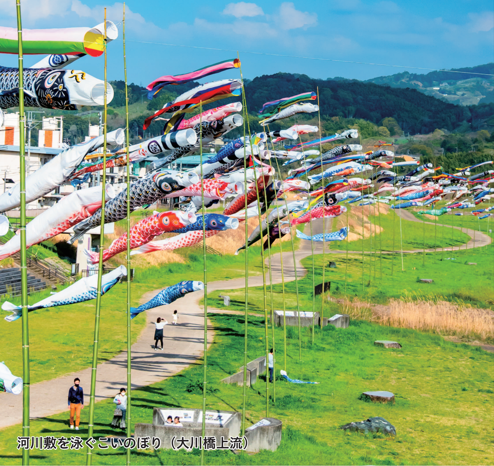
河川敷を泳ぐこいのぼり（大川橋上流）