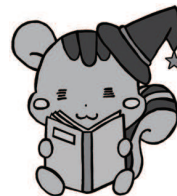
五條市立図書館 マスコットキャラ「すーくん」