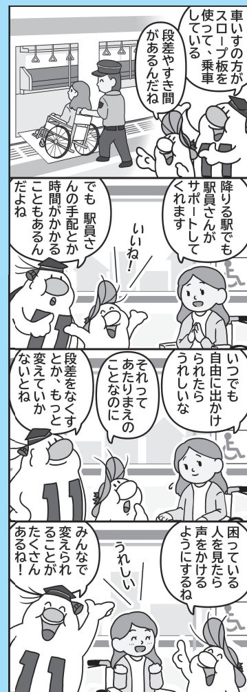
■問合先 人権施策課