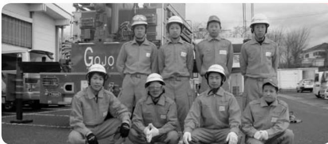
五條東中学校の生徒