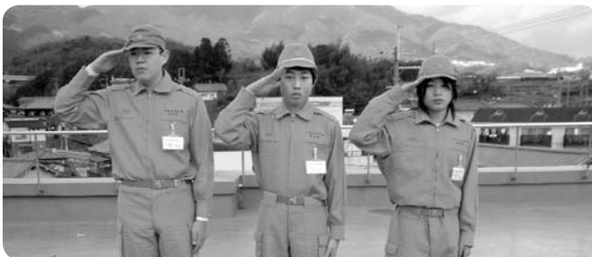
五條中学校の生徒