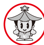
ゴーちゃん (五條市シンボルキャラクター)