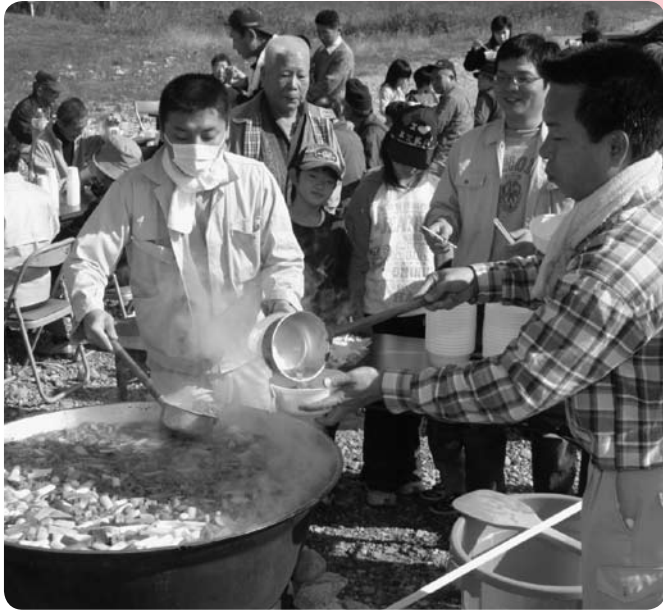
鍋いっぱいのもも煮