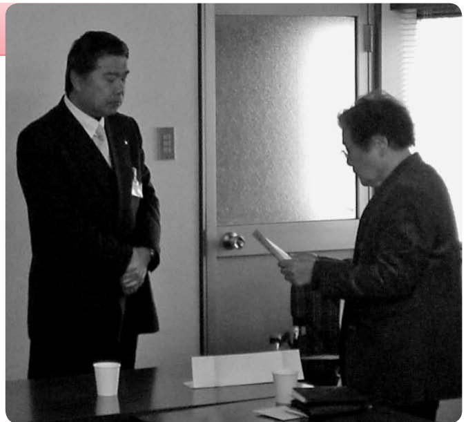
清水健康福祉部長に目録を手渡される