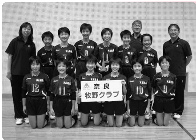
健闘した牧野クラブのみなさん