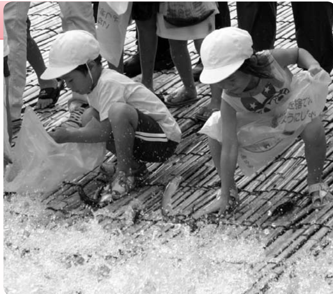
「やな」でアユをとる子供たち(上・下)