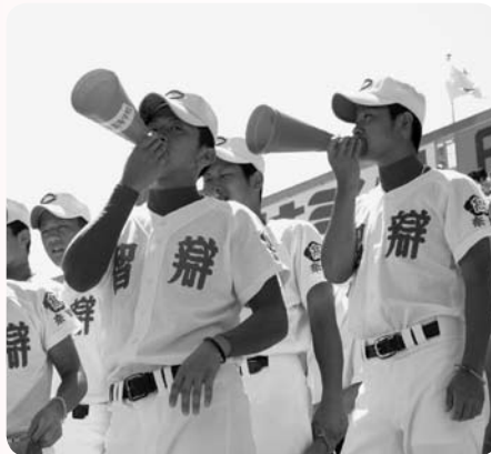
声援を送る野球部員