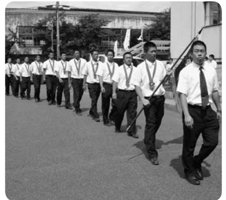
市役所での出場報告