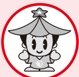
ゴーちゃん (五條市シンボルキャラクター)