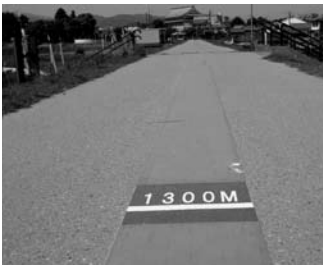
ウォーキング（トリム）コース