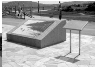
「水泳王国五條」の説明板