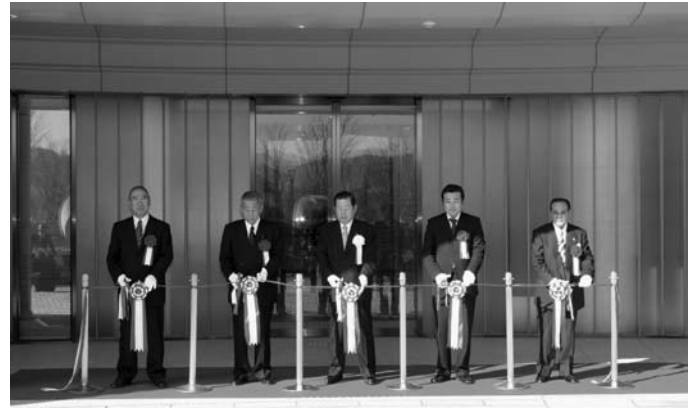
関係者によるテープカット