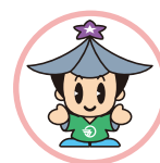
ゴーちゃん (五條市シンボルキャラクター)