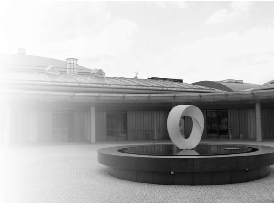
五條市斎場—ハートピアさくら—