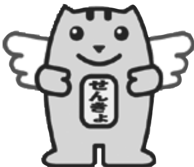
イメージキャラクター 「選挙のめいすい(明推)くん」