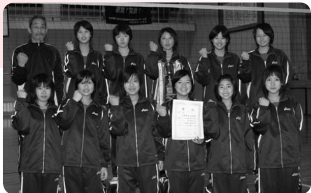
五條西中学校バレーボール部