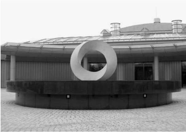
五條市斎場エントランス前のモニュメント