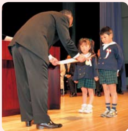
高崎会長から表彰状が贈られる