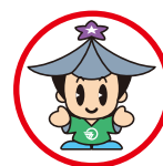
ゴーちゃん (五條市シンボルキャラクター)