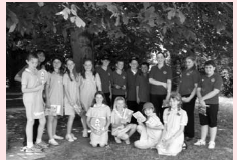
6年生になった子供たち

校舎の中に小さな部屋を借りました。そこで私は子供たちに入り口では、靴を脱ぐことを教えました。子供たちは静かに部屋に入ってきます。私は座り方を教え、それから日本のお菓子を渡しました。そしてお茶をたてました。次に最初の「実験台」の子供に茶わんを渡します。(その子はお辞儀をしてももちろん「オテマエ、チョウダイイタシマス」と言わなければなりません!)