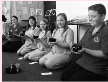
初めて抹茶を飲む子供たち

日本に来る前に、クラスの子供たちと約束しました。ご存じの方もいると思いますが、私は五條に来る前は6年間英国の小学校で教えていました。同じクラスを3年間受け持ったので、この子供たちとはとても親密な関係でした。私が日本に行くことを告げると、みんなはとても動揺したようです。もし私が日本に2年いたら、自分たちが中学校(11歳から)になるまでには、もう会うことができないとわかったからです。それで、わたしが日本に2年以上いることになるなら、みんなが小学校を卒業するまでに必ず会いに来ると約束したのです。